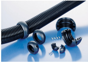
Abrasion protection sleeve