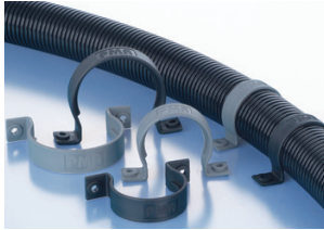
Tube clamp one-piece